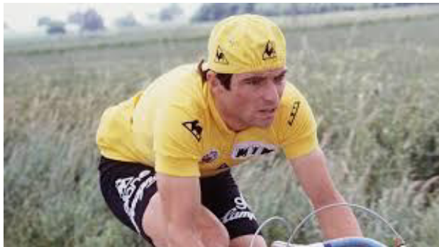
Bernard Hinault, cycliste professionnel de 1975 à 1986