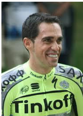
Alberto Contador, cycliste professionnel de 2003 à 2017

Alberto Contador (ESP), cycliste professionnel de 2003 à 2017 : « Depuis le début de ma carrière, j'ai passé près de 500 contrôles . En course ou inopinés. J'ai ouvert ma maison aux contrôleurs médicaux, j'ai dû quitter des salles de restaurant pour les suivre, me lever de table au cours de réunions de famille, quitter des salles de cinéma. Je l'ai fait parce que j'ai toujours cru au système antidopage. Aujourd'hui je n'y crois plus. » [L'Équipe, 29.01.2011]