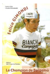
Felice Gimondi, le Champion de Bergamo, éd. Coups de Pédales, 2001