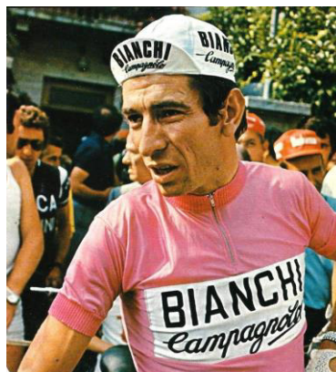
Felice Gimondi, lauréat du Giro 1976

Tour d'Italie (21.05-12.06) : 1 er [remporte une étape : 21]