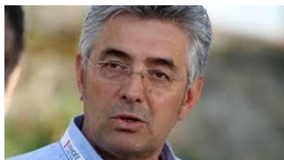
Marc Madiot, professionnel de 1980 à 1994

« Non. Laurent Jalabert vainqueur de la Flèche Wallonne gagnait des courses avant les contrôles, il continue d'en gagner. » [Le Parisien, 18.04.1997]