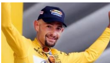
Marco Pantani, professionnel de 1992 à 2003

Marco Pantani (ITA), cycliste professionnel de 1992 à 2003 : « Rien à voir avec le doping (...) je suis un artisan, comparé à ceux qui fréquentent un préparateur ou certains centre médicaux (...). Le président de la fédération n'a qu'à aller courir contre Laurent Jalabert et les autres étrangers. » [Ndlr : sans dopage, il aura du mal à suivre...] [Gazzetta dello Sport, 10.06.1999]