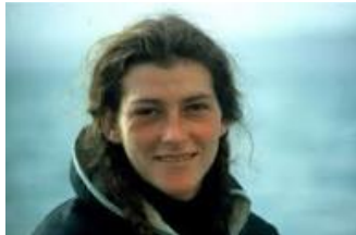
Florence Arthaud (Fra) (1957-2015), vainqueur de la Route du Rhum 1990

[ Votre Beauté , 1988, n° 614, février, p 9]