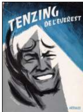
J.R. Ullman - Tenzing de l'Everest (autobiographie racontée à), éd. Arthaud, 1955 (p 32)

[Ullman J.R. - Tenzing de l'Everest (autobiographie racontée à) - Paris, éd. Arthaud, 1955. - 274 p (p 32)]