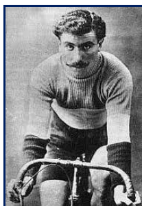
Le Français Octave Lapize, l'un des plus jeunes vainqueurs de Paris-Roubaix