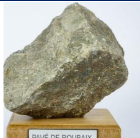
Le pavé, emblème de la course Paris-Roubaix