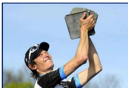
Le Belge Johan Van Summeren, le plus grand par la taille des vainqueurs de Paris-Roubaix