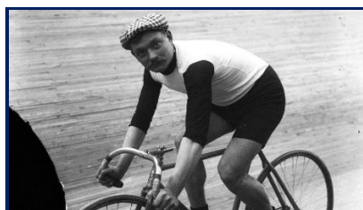
Le Français Henri Cornet, le plus petit des vainqueurs de Paris-Roubaix

(*) il sera naturalisé Français le 21.12.1901