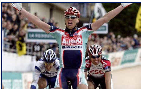
Le Suédois Magnus Backstedt, le plus lourd des vainqueurs de Paris-Roubaix