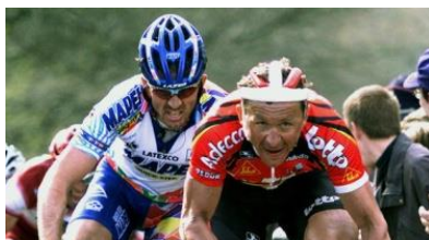
Le plus vieux : Andrei Tchmil, vainqueur en 2000