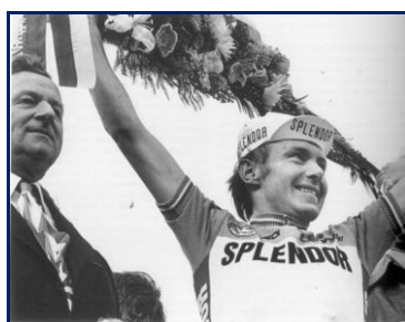
Michel Pollentier, lauréat en 1980, le plus petit et le plus léger des vainqueurs du Tour des Flandres