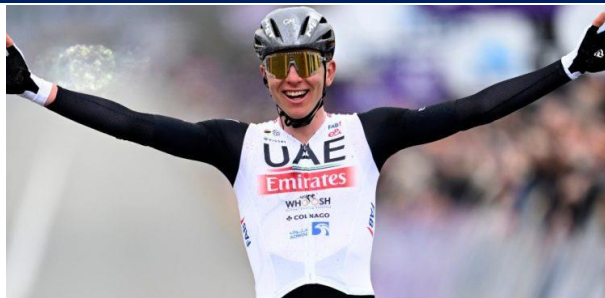
Louison Bobet, Eddy Merckx et Tadej Pogacar, vainqueurs du Ronde et du Tour de France