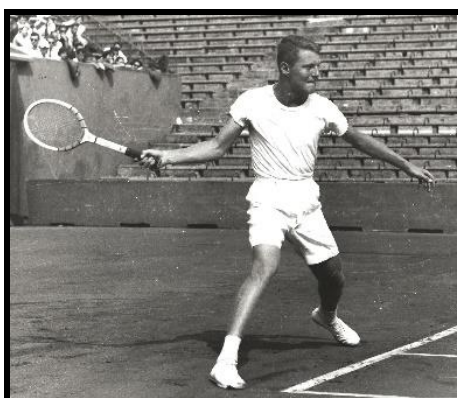
Hamilton Richardson (USA), 3 e mondial en 1956

Hamilton RICHARDSON (USA) (1933-2006), l'un des meilleurs joueurs de tennis américain des années 1950. A fait partie de l'équipe américaine de Coupe Davis de 1952 à 1958. A remporté la Coupe Davis en 1954 et 1958. Finaliste du simple et du double de Wimbledon en 1956. 3 e mondial en 1956, 6 e en 1958.