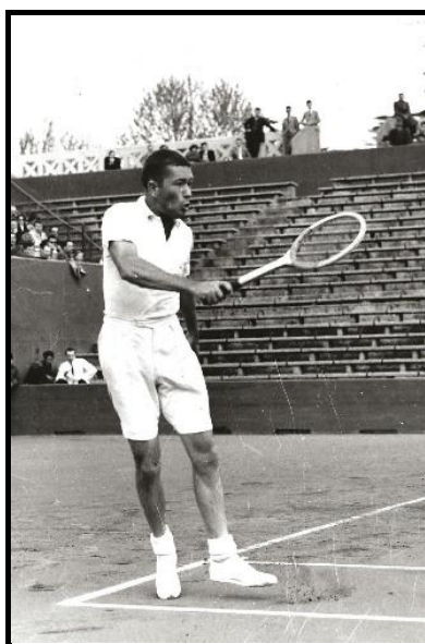
William Talbert (USA), 3 e mondial en 1949

William TALBERT (USA) (1918-1999), dit Billy , a remporté la Coupe Davis à trois reprises avec l'équipe des Etats-Unis; deux fois en tant que joueur (1948, 1949) et une fois en 1954 en tant que capitaine non-joueur; champion de double de l'US Open à Forest Hills associé à Gardner Mulloy en 1942, 1945, 1946 et 1948 ; vainqueur, associé à son presque homonyme Tony Trabert, du double des Internationaux de France à Roland-Garros en 1950 ; 6 e mondial en 1948, 3 e en 1949