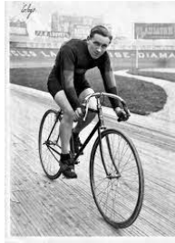
Philippe Thys (Bel) (1890-1971), triple vainqueur du Tour 1913-14-20

Wout VAN AERT (Bel) cycliste professionnel depuis 2012, lauréat de Milan-Sanremo 2021 : « Il n'y a aucune course semblable au Tour. Il y a tellement d'attention autour de vous, tant de choses qui gravitent autour de la course. On est branché dès le matin quand le réveil sonne jusqu'au soir quand vous retrouvez votre lit. C'est quand même trois semaines passionnantes à vivre. » [ Le magazine l'Equipe , 2023, n° 2128, 01 juillet, p 27]