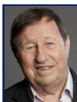
Guy Roux, entraîneur de l'équipe de football d'Auxerre de 1961 à 2000 puis de 2001 à 2005