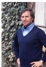
Michel Hidalgo, international de football, sélectionneur de l'équipe de France de 1976 à 1984.

Rodolphe "Rudi" HIDEN (Aut-Fra) , footballeur autrichien naturalisé français, 1 sélection internationale pour la France (1940) : « Le Tour de France ? Le rêve de tous ceux qui font du vélo. Le moindre champion au fin fond de l'Europe centrale, ne rêve que d'y participer un jour. » [Match l'Intran, 1936, n° 521, 07 juillet, p 10]