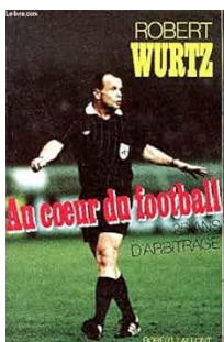
Robert Wurtz. – Au cœur du football . – Paris, éd. Robert Laffont, 1990

coureurs sur des cartes à jouer où ils progressaient à coups de dé ; je m'amusais à tenir les comptes et établissais des classements généraux à partir des résultats de chaque étape.» Alors qu'il n'avait pas sept ans, il se rappelle sa première rencontre avec les géants de la route : « Un jour de juillet, en 1948, il y eut une arrivée d'étape du Tour de France à Strasbourg. Dès neuf heures du matin, j'étais à pied d'œuvre pour voir la caravane publicitaire. L'étape se déroulait contre la montre (Ndla : 1 re étape, Mulhouse-Strasbourg, sur 120 km CLM, remportée par le Belge Roger Lambrecht) et se terminait sur une avenue près de la Meinau : au début de l'après-midi chaque coureur passa individuellement route de Colmar entre deux haies de spectateurs. j'étais pratiquement aux premières loges pour les voir se succéder sous mes fenêtres. Je me souviens très bien que le dernier concurrent portait le maillot jaune c'était Gino Bartali. » [Robert Wurtz. – Au cœur du football. – Paris, éd. Robert Laffont, 1990. – 251 p (p 31)]