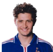
Bixente Lizarazu, footballeur professionnel de 1988 à 2006 ; 97 sélections

Bixente LIZARAZU (Fra) footballeur professionnel de 1988 à 2006 ; 97 sélections internationales de 1992 à 2004 ; consultant dans les médias : « Vous avez été invité sur la 17 e étape l'an passé (2022), une expérience qui vous a plu ? "C'était mon premier contact direct avec le Tour de France. L'étape entre Saint-Gaudens et Peyragudes c'était génial. J'étais dans la voiture du directeur adjoint de la course et j'ai pu côtoyer le peloton en pleine étape de montagne. C'est quelque chose, impressionnant franchement. Pour l'anecdote, j'ai pu échanger en fin de journée avec Christophe Laporte et deux jours après, il remportait sa première étape. Je lui ai peut-être porté bonheur !". » [Le Dauphiné Libéré, 17.07.2023]