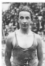
Jean Taris, international de natation, 49 sélections entre 1927 et 1946

Jean TARIS (Fra) international de natation, 49 sélections entre 1927 et 1946, médaille d'argent aux 400 m en 1932 aux JO de Los Angeles : « J'aime le Tour pour son ambiance sur les foules. Quels souvenirs ne doit-il pas laisser à tous ceux qui s'y alignent ? En Australie, lors de mes voyages, beaucoup de sportifs ne connaissaient la France que par le Tour. » [Match l'Intran, 1936, n° 521, 07 juillet, p 10]