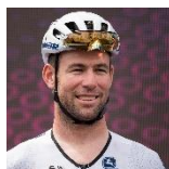
Mark Cavendish, cycliste professionnel depuis 2005