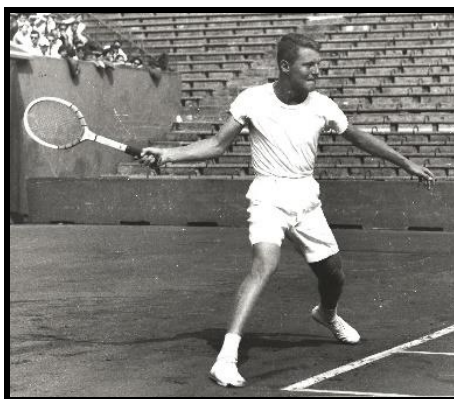
Hamilton Richardson (USA), 3 e mondial en 1956

Hamilton RICHARDSON (USA) (1933-2006), l'un des meilleurs joueurs de tennis américain des années 1950. A fait partie de l'équipe américaine de Coupe Davis de 1952 à 1958. A remporté la Coupe Davis en 1954 et 1958. Finaliste du simple et du double de Wimbledon en 1956. 3 e mondial en 1956, 6 e en 1958.