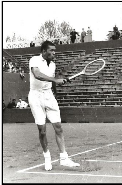
William Talbert (USA), 3 e mondial en 1949

William TALBERT (USA) (1918-1999), dit Billy , a remporté la Coupe Davis à trois reprises avec l'équipe des Etats-Unis; deux fois en tant que joueur (1948, 1949) et une fois en 1954 en tant que capitaine non-joueur; champion de double de l'US Open à Forest Hills associé à Gardnar Mulloy en 1942, 1945, 1946 et 1948 ; vainqueur, associé à son presque homonyme Tony Trabert, du double des Internationaux de France à Roland-Garros en 1950 ; 6 e mondial en 1948, 3 e en 1949