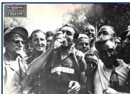
Tour de France 1949 – Emile Idée remporte la 13 e étape Toulouse-Nîmes