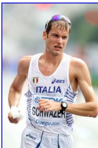
Alex Schwazer lors du Championnat du monde à Daegu (Cds) 2011 : 20 km (7 e )