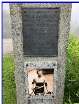
Stèle en hommage à René Pottier, 1 er vainqueur du Ballon d'Alsace – TDF 1905