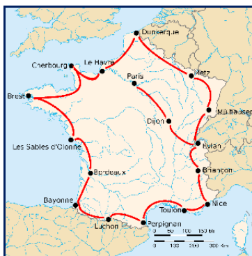
Tracé du Tour de France 1926

Le Belge Lucien Buysse, vainqueur de cette 20 e édition du Tour, peut également être considéré comme le meilleur grimpeur avec ses 12 passages en tête de cols sur 26, soit 46 % (les côtes n'ont pas été comptabilisées). De plus, il a remporté haut la main l'étape monstrueuse Bayonne-Luchon, 326 km avec quatre grands cols pyrénéens.