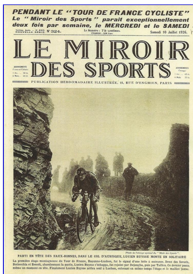
Le Miroir des Sports 1926, n° 324, 10 juillet

NC : non-classé – Le classement du Grand Prix de la Montagne ne sera instauré qu'à partir de 1933