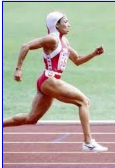
Florence Griffiths-Joyner (Etats-Unis) (1959-1998)

En 1988, championne olympique du 100 m, 200 m et 4x100 m à Séoul (Corée du Sud)