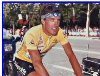
Pedro Delgado (Espagne) Lauréat du Tour de France 1988