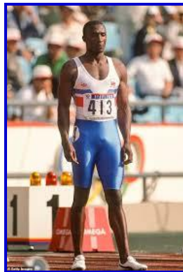
Linford Christie (Grande-Bretagne) - 1,89 m / 91 kg En 1992, champion olympique du 100 m à Barcelone (Espagne)