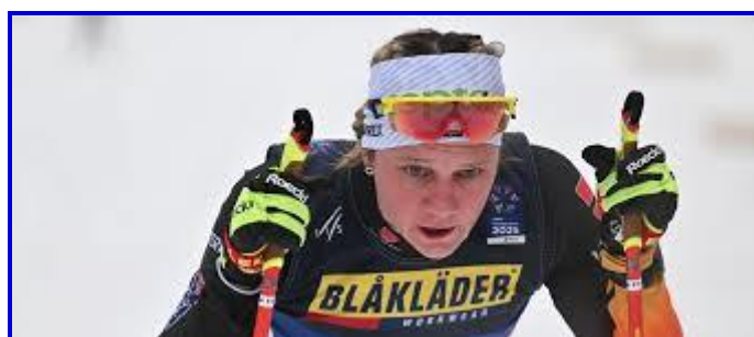
Victoria Carl (Allemagne)

Ski nordique – Médaille d'or au relais sprint des JO 2022 à Pékin (Chine)