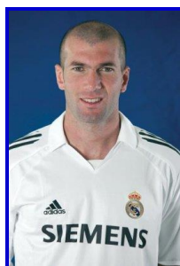
Zinedine Zidane (France)

Champion du monde de football 1998 et vice-champion 2006