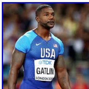
Justin Gatlin (Etats-Unis) – 1,85 m / 83 kg En 2004, champion olympique du 100 m à Athènes (Grèce)