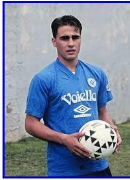
Fabio Cannavaro (Italie) Champion du monde de football 2006 (en Allemagne)