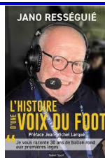
Jano Ressaygué - L'histoire d'une voix du foot – éd. Talent Sport, 2026

[in L'histoire d'une voix du foot par Jano Ressaygué. – Paris, Talent Sport, 2026. – 268 p (pp 177-178)]