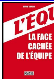
David Garcia – La face cachée de L'Équipe – éd. Danger Public, 2008