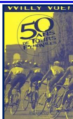
Willy Voet – 50 ans de Tours pendables – éd. Flammarion, 2002

En fin de soirée, il ne me restait plus qu'à regagner ma chambre et à attendre. Le rendez-vous avait été fixé à 11 heures du matin dans le hall de l'hôtel. À l'heure dite, je retrouvai l'équipe de tournage. Après les présentations, un homme visiblement à son affaire s'approcha de moi :