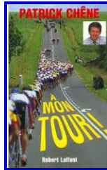
Patrick Chêne – A mon Tour ! – éd. Robert Laffont, 1998

- Avec le froid et le manque d'entraînement, tu ne dépasseras jamais les deux cents bornes ! (...)